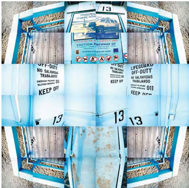
Life Guard Tower #13, Santa Monica