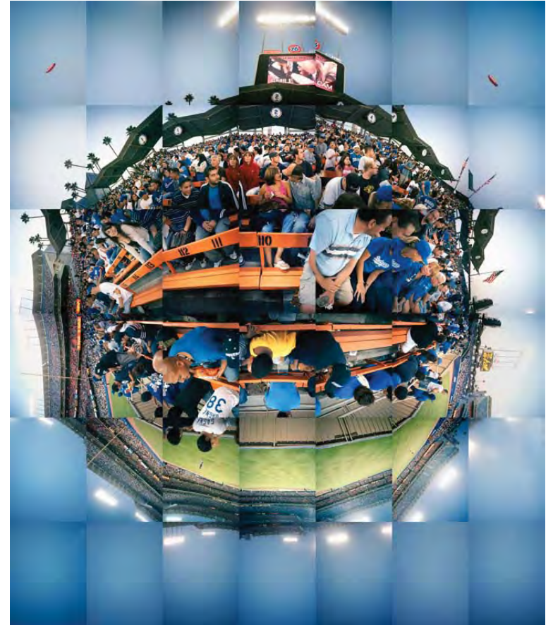
Dodger Stadium, Los Angeles